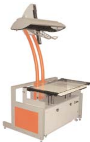
Abb.: OS 10000 DIN A1 mit Buchwippe

10000 (Omniscan 10000 TT für Vorlagen bis zur Größe DIN A2, Omniscan 10000 für bis zu A1 und Omniscan 10000 für bis zu A0) vorgestellt. Diese Scannerreihe liefert Images in Schwarz/Weiß, Graustufen oder Farbe.