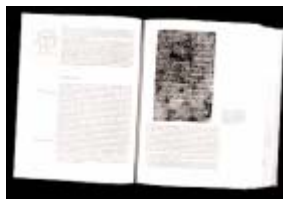
Abb.: Image ohne OrthoScan

Auch bei einer schief liegenden Vorlage erkennt der Scanner genau die Falzmitte sowie die Seitenumrisse. Er scant die beiden Seiten gerade und ohne schwarzen Rand. Die Zeilenkrümmung, eine Folge der Blattwölbung zur Buchmitte hin, verschwindet ebenso wie der schwarze Schattenstrich des Falzes.