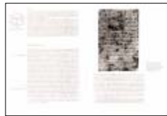
Abb.: Image mit OrthoScan

Die optionale Unschärfmaskierung das einzige verlustfreie Schärfungsverfahren beseitigt dann auch noch die physikalisch unvermeidbare Scanunschärfe und liefert in der Reproduktion ein gestochen scharfes, originalgetreues Schriftbild.