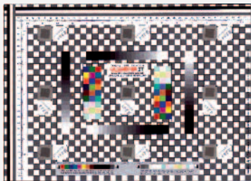
Messbare Qualität mit Test Targets (UTT + DSTT)